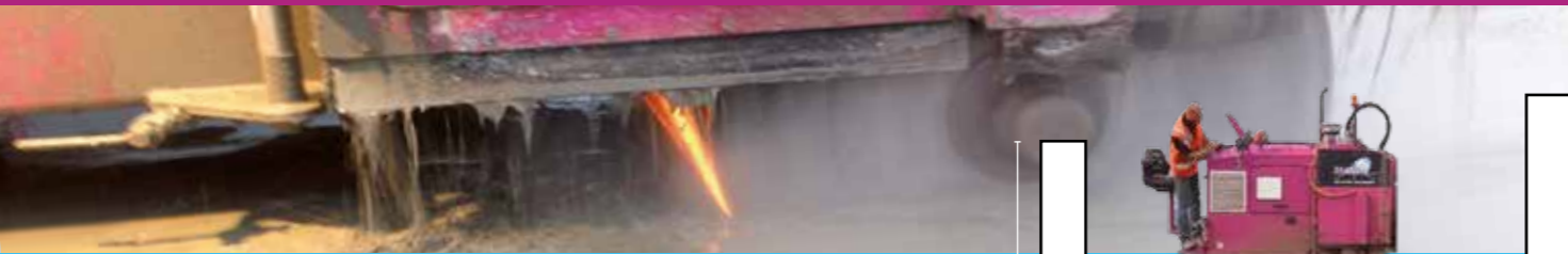
Obstakels hoger dan 10 cm